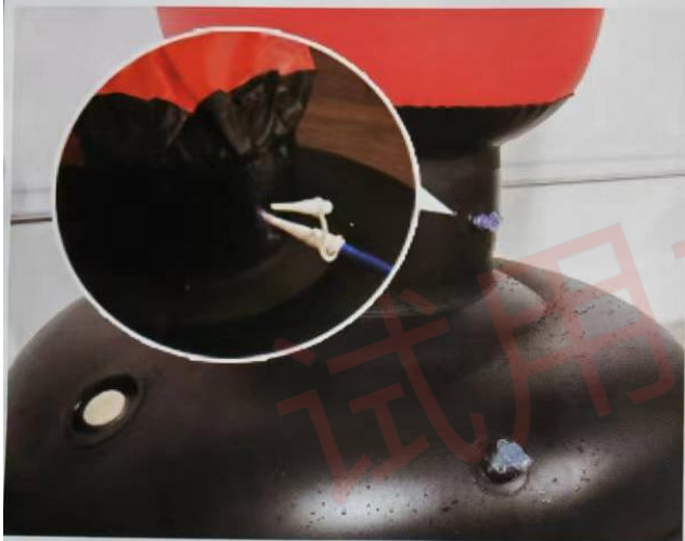
3 press the air pump by hand Or foot to inflate