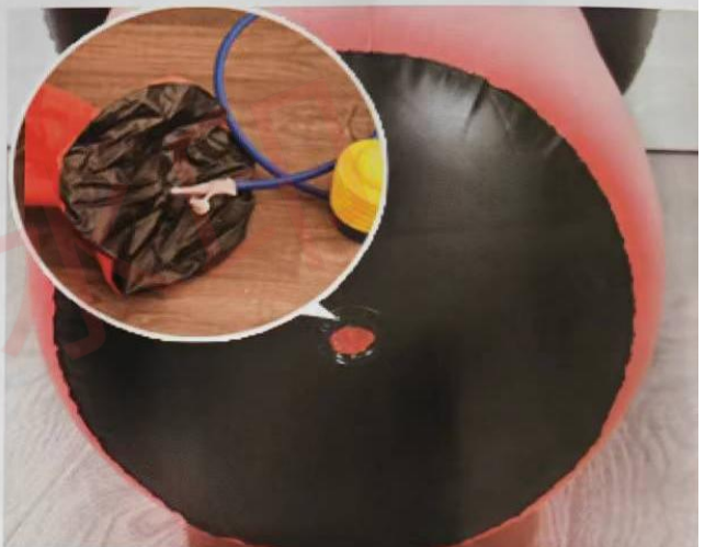
4 press the air pump by hand Or foot to inflate