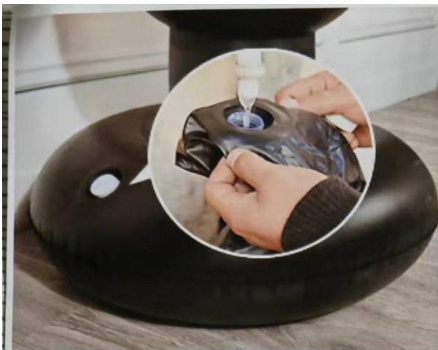
1 Pour some water Or sand into the bottom hole.It is recommended to note more than 15L.