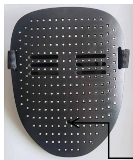
Position du capteur