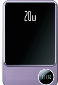
100%LED screen power display 100%LED残量表示

Magnetic suction wireless mobile power supply マグネット式ワイヤレス モバイルバッテリー